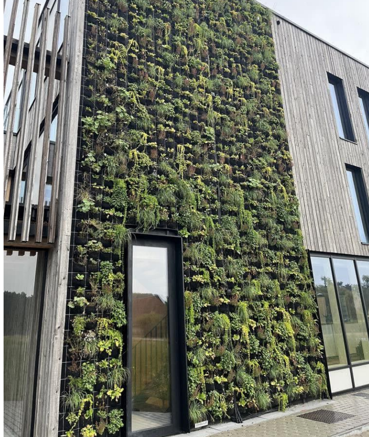
La verdure verticale donne de la couleur et de la texture au bâtiment et à son environnement